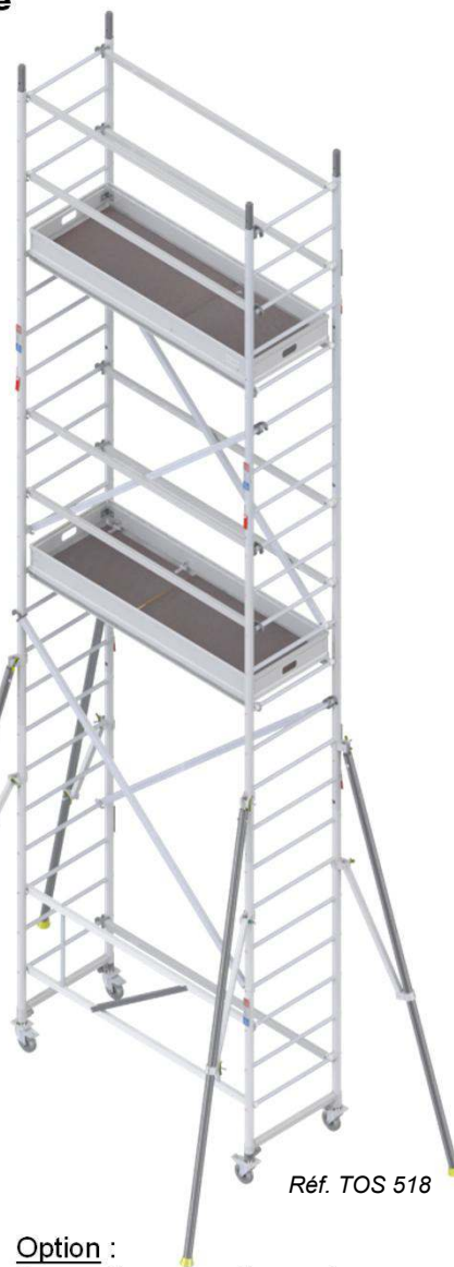
Réf. TOS 518